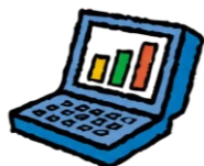
計測・試験システム

私たちの受託開発の特徴は、特定の分野に限らず、お客様の多様なニーズに応じて、計測試験システム開発、データベース設計、画像処理システム開発、装置開発まで幅広い技術領域を組み合わせ、課題解決に取り組んでいる点です。