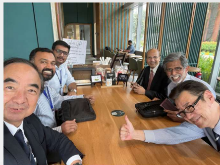
海外子会社とのミーティング