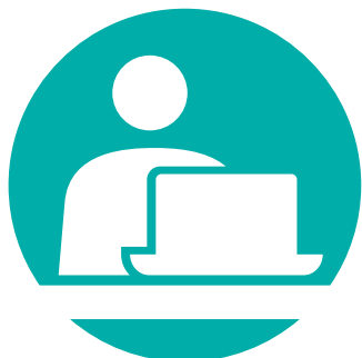
Webサイト制作・Webデザイン Webマーケティング