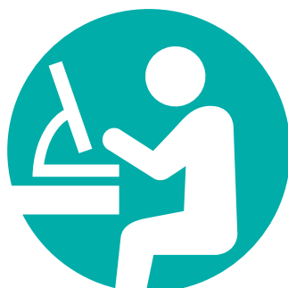
企業常駐ソフトウェア開発