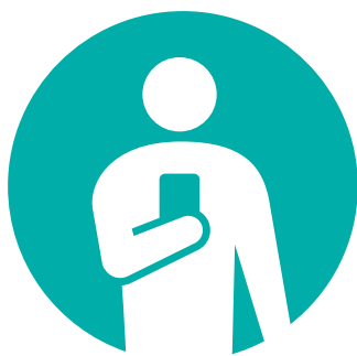
Webアプリ・ECサイト関連